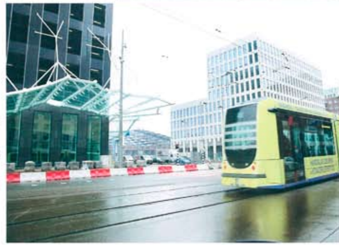
Boven, in het midden De Maastoren van Dam & Partners Architecten. Rechts Las Palmas, waar door Benthem Crouwel een nieuw deel werd opgezet. Rechts Via de Erasmusbrug kwam er ook eindelijk een openbaarvervoerverbinding tussen Rotterdam Noord en Zuid. Rechterpagina, rechts World Port Center van Norman Foster.