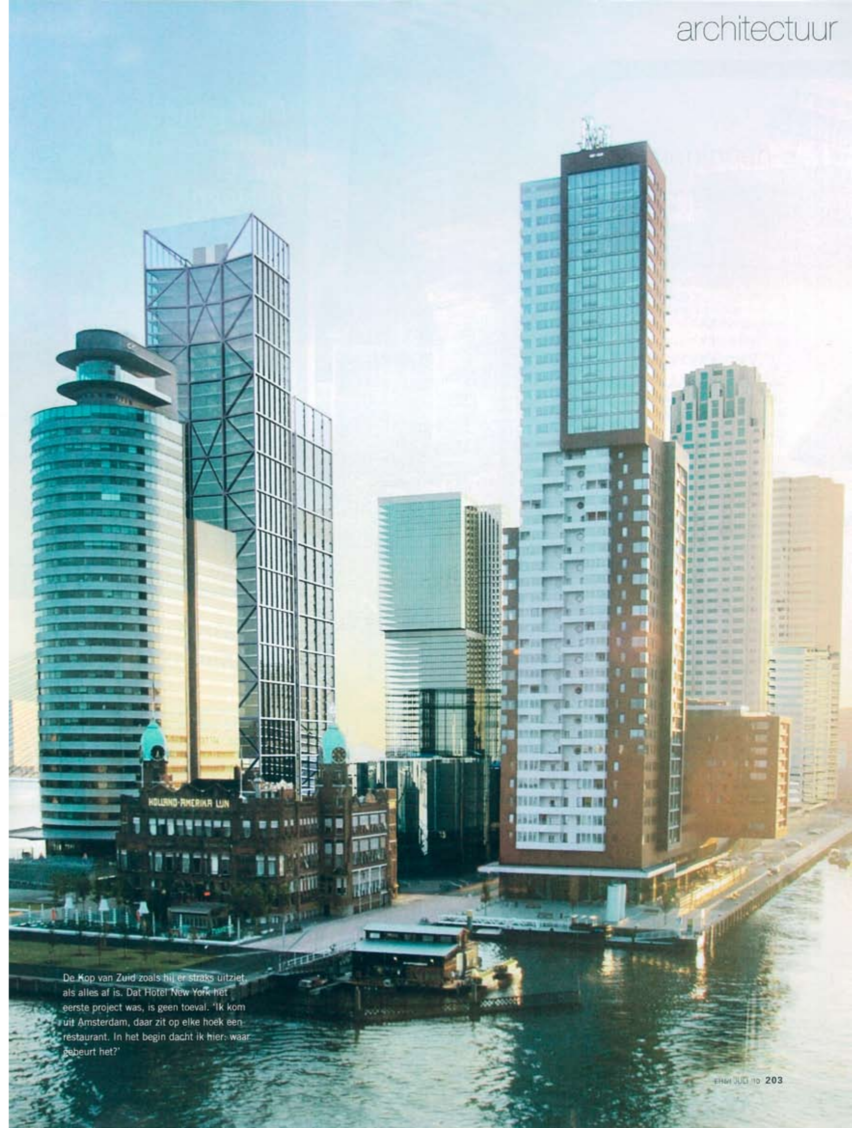
De Kop van Zuid zoals hij er straks uitziet, als alles af is. Dat Hotel New York het eerste project was, is geen toeval. 'Ik kom uit Amsterdam, daar zit op elke hoek een restaurant. In het begin dacht ik hier: waar gebeurt het?'

Ondanks de metamorfose blijft de stedenbouwkundige bescheiden over haar rol: 'Succes heeft vele vaders en moeders.' Maar haar communicatietalent ligt zonder meer ten grondslag aan het nieuwe imago van Zuid. 'Eén ding wist ik zeker: ik moet dat plan snel en waanzinnig goed communiceren, zodat het inslaat als een bom. Als ik te fragiel was, niet robuust, kon het mislukken. Je moet het ijzer smeden als het heet is en er dan een flinke dreun op geven. Dat was onze strategie om het voor elkaar te krijgen.' Dus toen het Rotterdamse bestuur het kabinet wilde ►